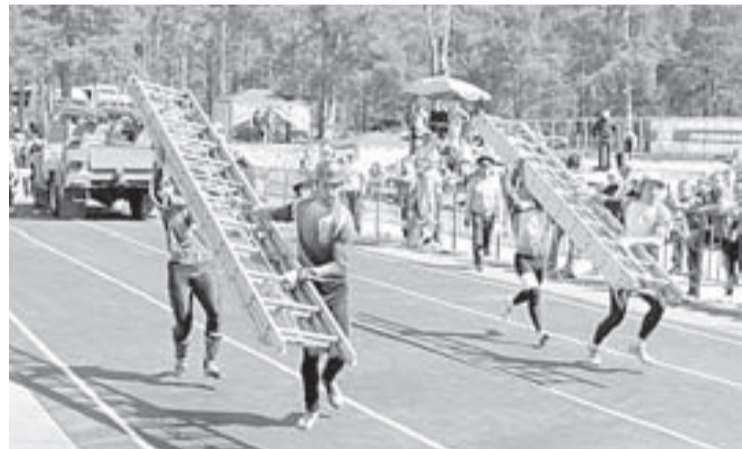
Фото предоставлено А. Баркаевым.

ФГКУ «Специальное управление ФПС №66 МЧС России».